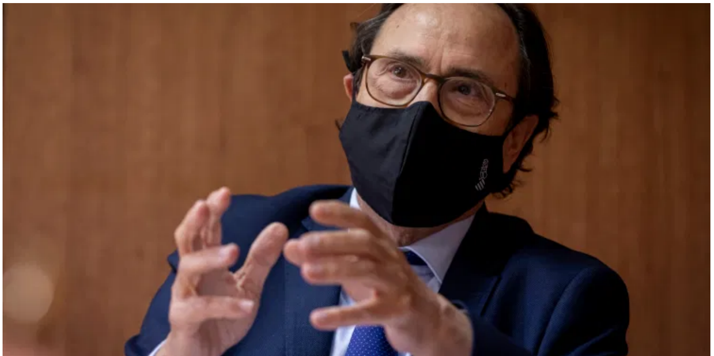
lografía Miguel Lorenzo